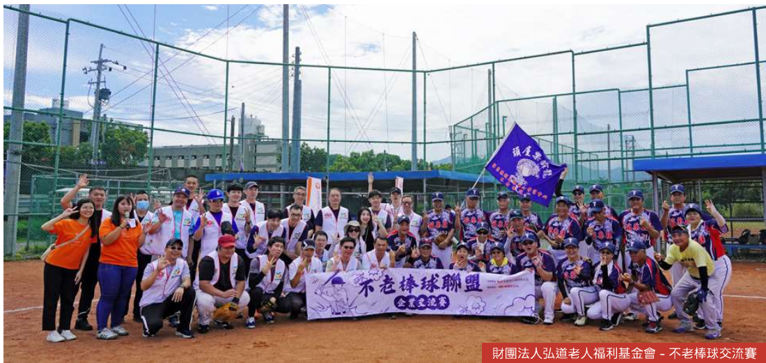
財團法人弘道老人福利基金會 - 不老棒球交流賽