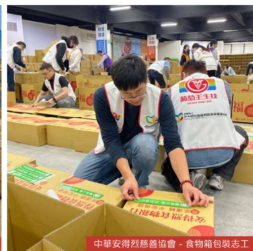
中華安得烈慈善協會 - 食物箱包裝志工