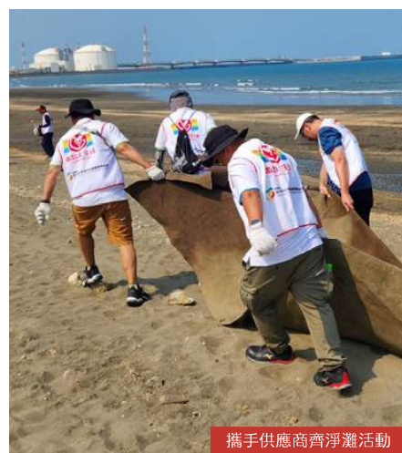
攜手供應商齊淨灘活動