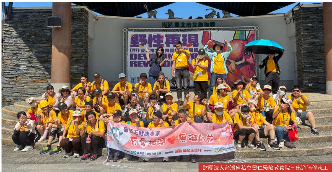
財團法人台灣省私立景仁殘障教養院 - 出遊陪伴志工