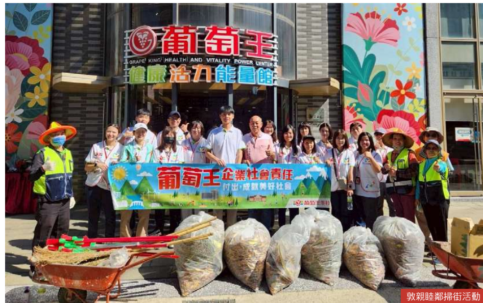
敦親睦鄰掃街活動